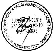
NAHIL LICIANA HIRSH CARRILLO Superintendente Nacional SUPERINTENDENCIA NACIONAL DE ADMINISTRACION TRIBUTARIA