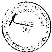
p. LA SUNAT NASSER BENJAMIN SACA AGUILAR Intendente Nacional INTENDENCIA NACIONAL DE ADMINISTRACION