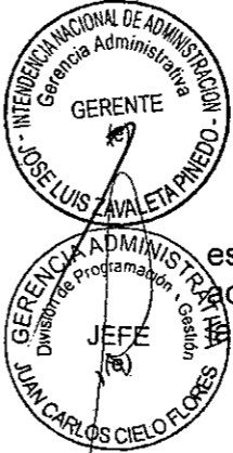
HORACIO JAVIER BARRIOS CRUZ Intendente Nacional (e) INTENDENCIA NACIONAL DE ADMINISTRACIÓN