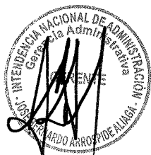
----- CARMEN SALARDI BRAMONT Intendente Nacional INTENDENTE NACIONAL DE ADMINISTRACIÓN