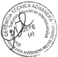
ROSA MERCEDES CARRASCO AGUADO Intendente Nacional (e) Intendencia Nacional de Desarrollo e Innovación Aduanera SUPERINTENDENCIA NACIONAL ADJUNTA DE ADUANAS